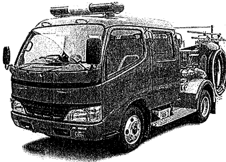
納入車両イメージ図