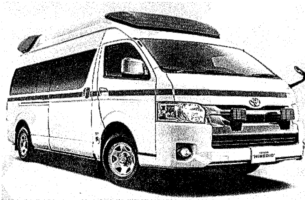
納入車両イメージ図（車種：トヨタ）