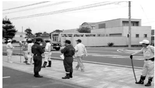
9月8日のサル一斉捕獲作戦には議員も参加