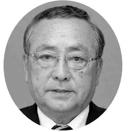
木田吉信 議員 (政真会)

答 合計特殊出生率が急速に低下し、人口減少の局面に入り、今後とも加速度的に進行すると予測されている。まずは「しごと創生」が最重要課題であり、「若者定住雇用創出プロジェクト」の推進・人材育成に取り組む。人口減少により、地域経済の衰退が懸念されるので、海のインフラと陸のインフラの相乗効果により、経済効果を最大限発揮できるように努めていきたい。