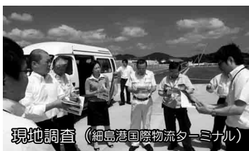
現地調査 (細島港国際物流ターミナル)

答 おが粉問題は県等と対応する。子牛対策は市の事業活用と農家への指導を行う。鳥獣被害対策は農地について、これまで約120キロメートルの侵入防護柵を設置した。猿対策は檻、箱罠の導入や捕獲活動に対する支援を行った。遊休農解消として、「薬草の里づくり」を目的し適地選定を行う。