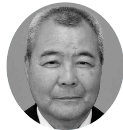
海野誓生 議員 (社民・民主の会)