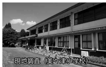
現地調査 (美々津小学校)