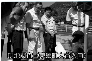
現地調査 (東郷町大谷入口)

6月29日、現地調査を踏まえ、慎重に審査した結果、全員一致で原案のとおり承認・可決しました。 審査を踏まえ、次の点を委員会の意見として付記しました。 観光振興課所管の、平成27年度一般会計予算中の、「観光客誘致推進事業」において、本市の観光拠点施設である「道の駅日向」をはじめ、「道の駅とうごう」「まちの駅とみたか」「海の駅ほそしま」が連携し、再編と強化を図るため、外部専門家（地域力創造アドバイザー）を招へいして、地域間競争を勝ち抜く観光戦略の策定や、新たな観光商品の開発等を行うとのことであるが、日向市の特性に即したアドバイザーの招へいに努められたい。