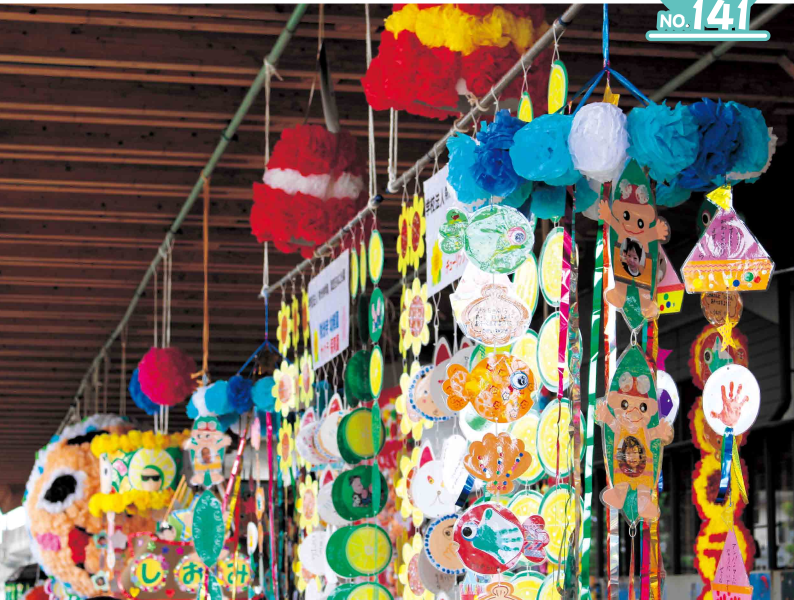
第11回日向七夕まつり (日向市駅前)

6月定例会 (平成27年第4回定例会) 会期 6月12日~7月3日 (22日間)