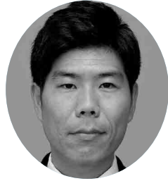
富井寿一 議員 (社民・民主の会)

答 本市のホームページの外国語観光情報については一部であり、観光情報については日本語のみとなっている。今後、アジアの経済成長によるインバウンド観光の推進やアジアを中心とした豪華クルーズ客船の寄港増加、円安傾向によって、訪日外国人が増加することが予想され、情報発信環境の整備はますます重要になってくると考えている。本市の魅力や観光地を広く知ってもらうためにも、外国語表記については検討していく。