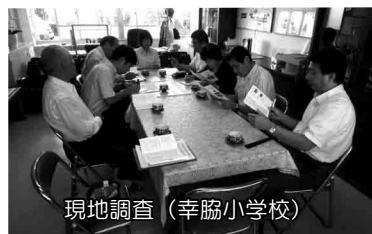
現地調査 (幸協小学校)

審査を踏まえ、次の点を委員会の意見として付記しました。 今回の委員会説明資料等について、一部記載の誤りが見られたことや、資料の説明内容について、いかようにもとれるような表現が見られたことから、今後、議会への説明資料等の作成にあたっては、担当部課において慎重にチェックを行うとともに、適切な表現で記載するよう努められたい。