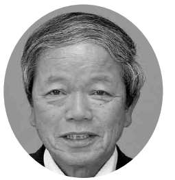
黒木万治 議員 (日本共産党市議団)

答 少子化対策の一環として「乳幼児医療制度の充実」を掲げ、平成25年10月に助成対象年齢を小学校卒業までに拡大し支援策を講じてきた。医師会等との協力が必要だが、子育て環境の充実を図る為には必要なことと認識しているので、実施する方向で検討したい。