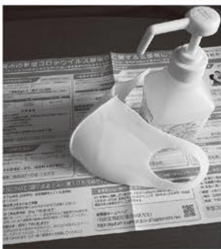
▲ 求められる市民に寄り添うサービス

A 地域に根差した医療を提供できる「無床診療所」として運営を継続。医師の負担軽減と定着化を図る。災害時の対応は避難所等に医療