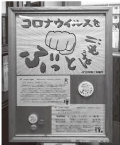
▲コロナ禍における様々な支援

議会傍聴に行ってみよう! どなたでも傍聴することができます。 気軽に庁舎4階傍聴席までお越しください。