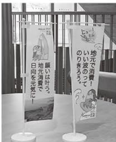
▲ 地元消費を後押しするのぼり旗

A 「地域マッチングデリバリー」の取り組みは、実証実験も兼ねており、今後のビジネスモデルに繋がるかと期待され、追加補正予算として提案する予定である。