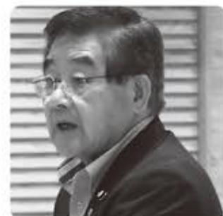
にしむら おさむ 西村 豪武 議員