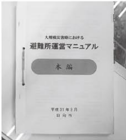
▲防災のガイドラインを広く周知