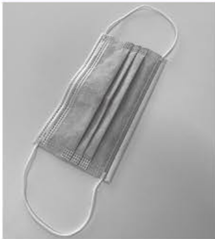
▲新しい生活様式の必需品であるマスク