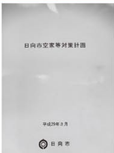
▲ 日向市の空家対策はこれに基づいて

A 平成29年（2017年）3月に策定した「日向市空家等対策計画」に基づき実態調査や市民からの相談、また、啓発活動に取り組んできたところである。