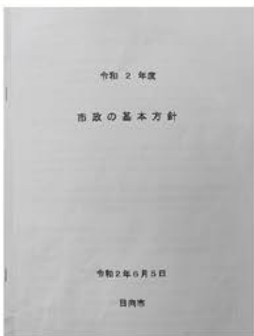
▲ 市民が笑顔になる市政運営を

A 1期目で掲げた政策課題は7割から8割程度達成することができた。今後の4年間は、コロナ禍から「市民の命と健康を守る」「市民の暮らしを支える」「市民が笑顔で暮らせるまちを取り戻す」施策の推進に注力していきたい。