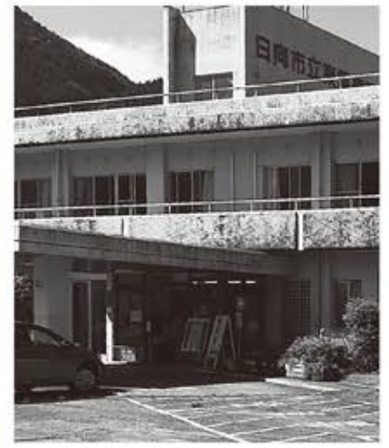
▲入院体制を整え存続を望む市立東郷病院

Q1 日向市では、数年前まで産婦人科が多数存在していたが、今では1病院だけ。有床化にして産婦人科部門を設置できないか。 A 東郷病院においては、これまで、住民への医療サービスの提供や健康の保持増進に努めてきた。今回の方針決定にあたっては、住民の受 Q2 安定した病院経営にするには、東郷町域における人口増策が必要。東郷工業団地の進捗状況は。 A 今後、発生が危険される南海トラフ地震等の津波リスクを回避できる内陸型 Q3 コロナ禍により中国をはじめ各国からの部材が入らず、建築部門の遅れが目立っている。財光寺南土地区画整理事業 A 本事業については、建物移転総数1544棟に対し、令和元年度末現在で、建物移転率91・6%となっている。コロナ禍において建築している業者によると、住宅設備メーカーによつては、一部、入手困難な部品等があったが、新築住宅の引き渡しに、遅れが生じないように努めている。現状において、事業進捗に大きく影響するものではない。 市長