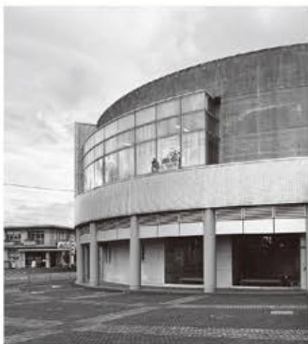
▲ ハラスメント等の相談ができる「さんびあ」

A ハラスメントの相談等は本市の男女共同参画相談員が受ける場合があり、昨年は2件あった。しかし、労働相談は訴訟等に発展することがあるため、労働問題の専門機関を案内している。現在、第5次日向市男女共同