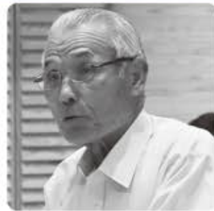
くろぎ かねき 黒木 金喜 議員

それぞれの議員が、どんな質問や提言をして行政は、どのような答弁をしているのかを見てみよう！