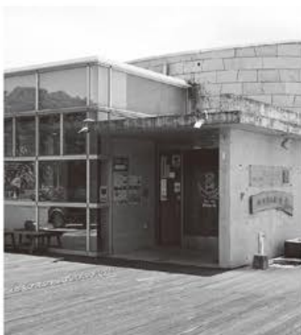
▲ 9月末で休館する「お舟出の湯」

通信環境の格差が課題となっている。こうした中、コロナ禍への対応を進めるため、「新たな日常」に必要な情報通信基盤の整備が急務となっており、在宅勤務によるテレワークや教育ICT環境の実現などにおいて、地域間の格差是正が必要。情報通信事業者と連携して、全的に光ファイバーを整備。本年度中に、高速ネットワーク環境の整備に着手したい。【市長】