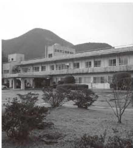
▲有床化を望む声がある市立東郷病院