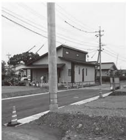
▲重点的に取り組む予定の区画整理(財光寺)

市長 進捗状況は、財光寺南地区の建物移転総数1544棟に対し91.6%、日向市駅周辺地区の建物移転総数345棟に対し、72.5%である。今後も建物移転を重点的に取り組みたいが、事業収束に