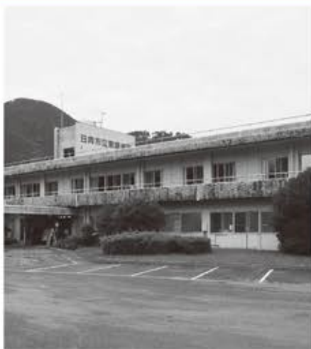
▲無床診療所への移行を決断した市立東郷病院

市長 マスクは熱中症等を考慮して適切に対応。エアコンは換気しながら使用。運動会は、従来の形式ではなく各学校で代替的な取り組みを進める。修学旅行等は状況次第で2学期以降に実施予定。中止や行き先を県内に変更する状況もあるが、子どもたちには、可能な限り潤いのある学校生活を送りたい。